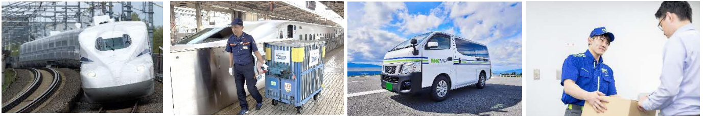
▲N Xスーパーエクスプレスカargo輸送サービスの提供イメージ

今後も日本通運とＪＲ東海は、お客様の多様なニーズにお応えできるよう、努めてまいります。